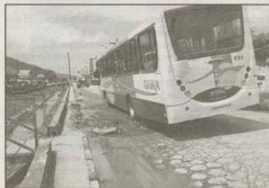
Buracos e alagamentos fazem parte da rotina da via