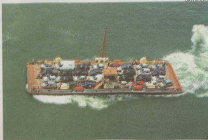
Espera por travessias tem levado 40 minutos em média

sobre entrega da reforma do atracadouro, danificado depois da colisão entre uma balsa e o navio de bandeira chinesa Zhen Hua 27, e diz esperar entrega até o final de novembro