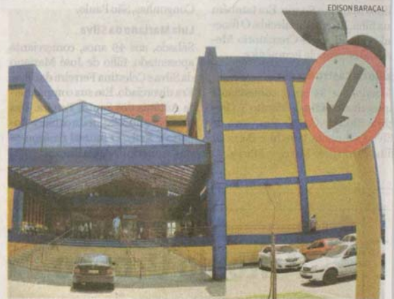
Prefeitura de Guarujá investiu cerca de R$ 60 mil nas melhorias

A partir de agora, todas as demandas e solicitações feitas à Administração Municipal estão sendo registradas em um único sistema de informações. Após o recebimento dos chamados, os técnicos do setor registram e dão o suporte inicial