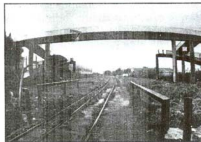
Com isso, pedestres têm de se arriscar na linha férrea