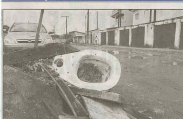
Além das ruas sem asfalto, acúmulos de lixo em alguns pontos do bairro causam muitos transtornos